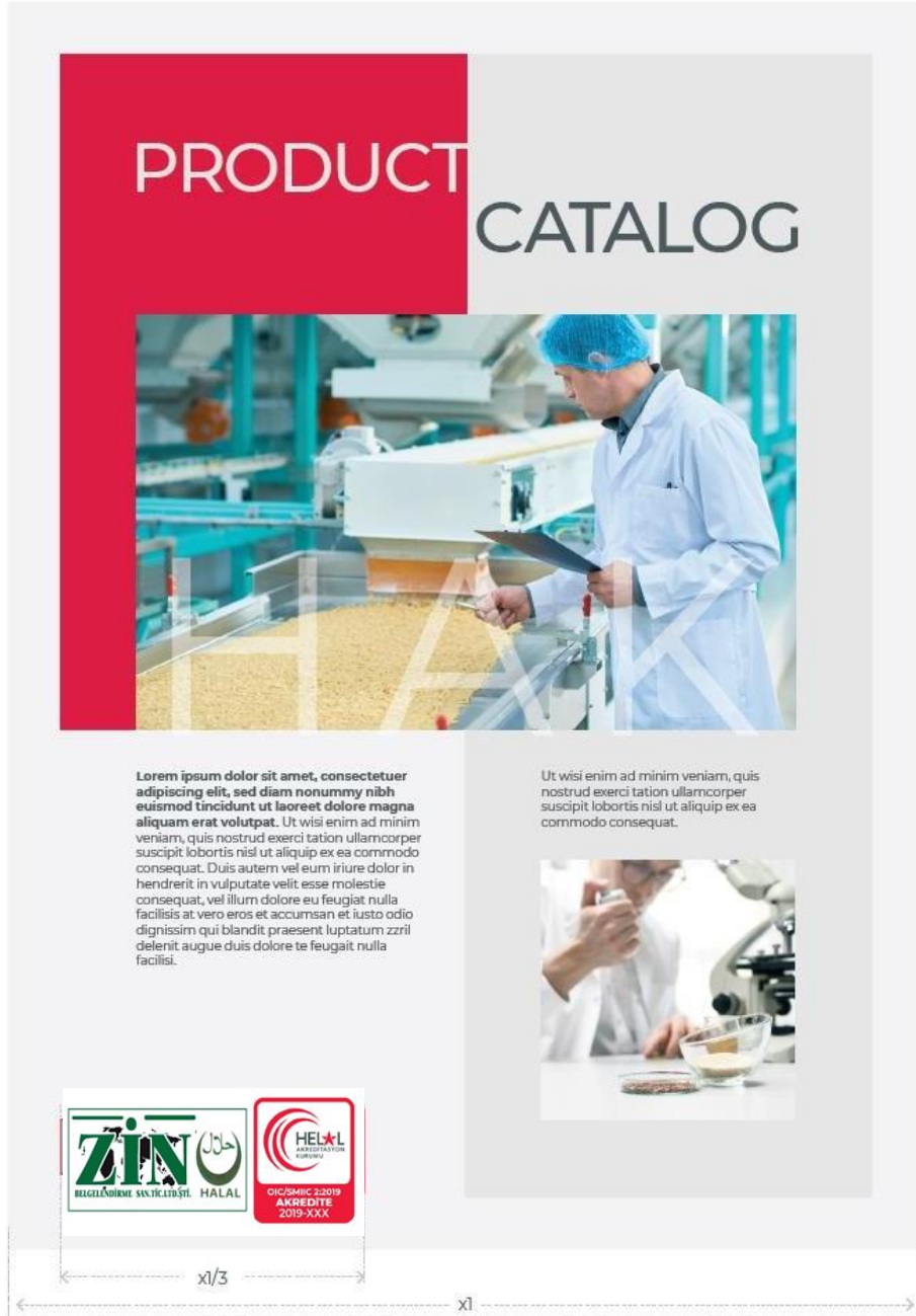
Şekil-8: HAK Helal Akreditasyon Kurumu markasının Basılı ve Görsel Tanıtım Malzemelerinin Üzerinde Kullanımı